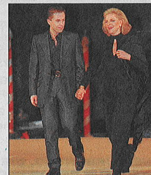
Mode-«Cäsar» Gai Mattiolo und Star Lauren Bacall.

Auch Mattiolos Kundenliste liest sich wie das «Who is Who» der Prominenten: Ira von Fürstenberg, Ursi Andress, Bo Derek, Darryl Hannah, Raissa Gorbatschowa und Jordaniens Königin Nur.